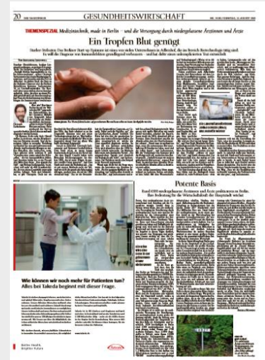
Beispiel: Themenspezial „Gesundheitswirtschaft“ 28.05.2020

Weitere Formate auf Anfrage. Preis Mo.–Fr., 4c: 8,85 € pro mm. Es gilt die Preisliste Nr. 61 vom 1. Januar 2021. Weitere Informationen und unsere AGBs finden Sie auf www.anzeigenpreise.tagesspiegel.de