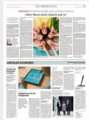
Beispiel: Beilage Dezember 2020

Weitere Formate auf Anfrage. Es gilt die Preisliste Nr. 61 vom 1. Januar 2021. Weitere Informationen und unsere AGBs finden Sie auf www.anzeigenpreise.tagesspiegel.de