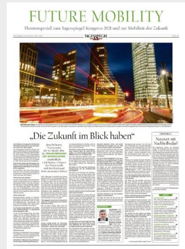
Beispiel: Beilage Juni 2021

Weitere Formate auf Anfrage. Preis Sa.– So., 4c: 8,85 € pro mm. Es gilt die Preisliste Nr. 61 vom 1. Januar 2021. Weitere Informationen und unsere AGBs finden Sie auf www.anzeigenpreise.tagesspiegel.de