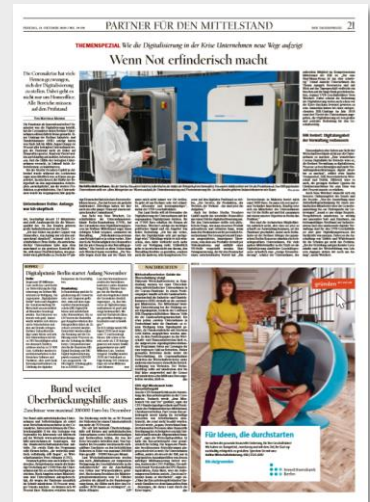
Musterseiten vom 23.10.2020

Weitere Formate auf Anfrage. Preis Mo.–Fr., 4c: 8,85 € pro mm. Es gilt die Preisliste Nr. 61 vom 1. Januar 2021. Weitere Informationen und unsere AGBs finden Sie auf www.anzeigenpreise.tagesspiegel.de