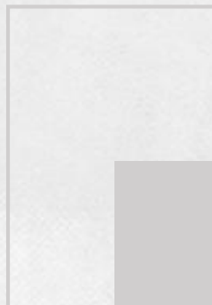
1/4 Seite Eckfeld B 184,5 x H 264 mm