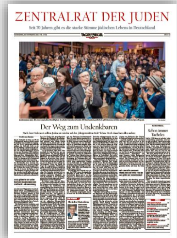
Beispiel Beilage 70 Jahre Zentralrat der Juden 2020

Weitere Formate auf Anfrage. Preis Mo.– Fr., 4c: 8,45 € pro mm. Es gilt die Preisliste Nr. 61 vom 1. Januar 2021. Die Preise sind AE-fähig und zzgl. gesetzlicher MwSt. Weitere Informationen und unsere AGBs finden Sie auf www.anzeigenpreise.tagesspiegel.de