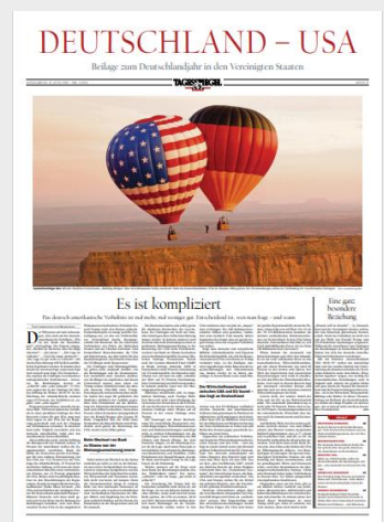
Beispiel: Beilage Deutschlandjahr USA 2019

Es gilt die Preisliste Nr. 61 vom 1. Januar 2021. Die Preise sind AE-fähig und zzgl. gesetzlicher MwSt. Weitere Informationen und unsere AGBs finden Sie auf www.anzeigenpreise.tagesspiegel.de