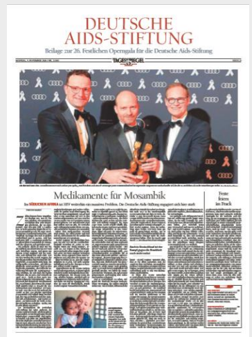
Beispiel Beilage Deutsche-Aids-Stiftung 2019