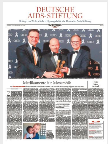
Beispiel Beilage Deutsche-Aids-Stiftung 2019