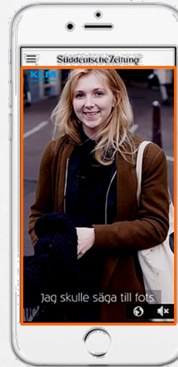
Scribble: Mobile Vertical

Originär für Mobile-Bedürfnisse entwickelt und bekannt aus den Sozialen Medien genießt das Format eine hohe User-Akzeptanz.