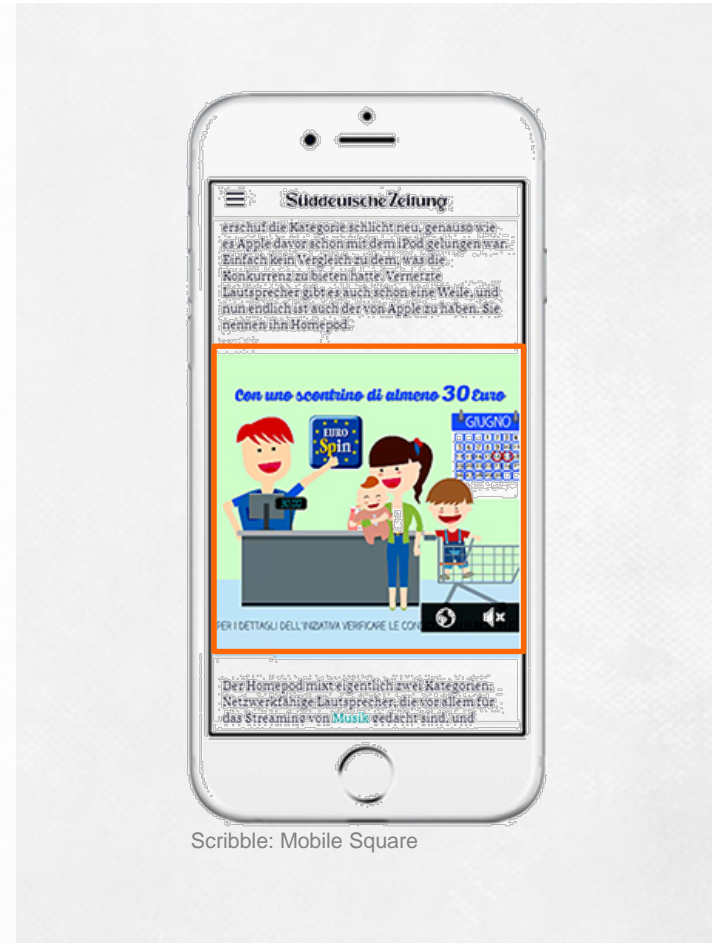
Scribble: Mobile Square

Originär für die Mobile-Bedürfnisse entwickelt und jetzt im Premium-Umfeld unserer Leitmedien verfügbar.