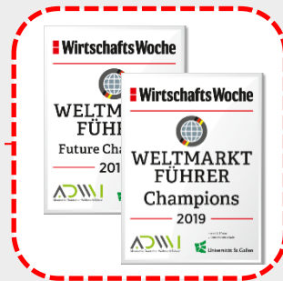
Ranking & Siegel

Mit ca. 500 Teilnehmern das bundesweit größte Treffen von Wirtschaftslenkern von heute und Weltmarktführern von morgen.