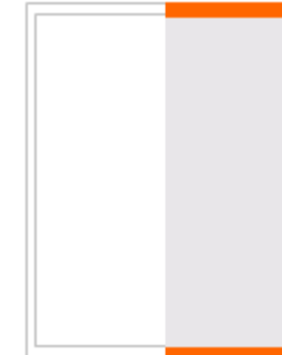
1/3 Seite hoch

Breite 188/220 Höhe 133/151 Preis 6.400 Euro