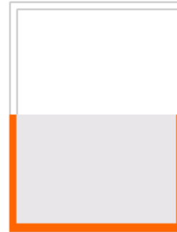
1/2 Seite quer

Breite 188/220 Höhe 271/300 Preis 10.600 Euro