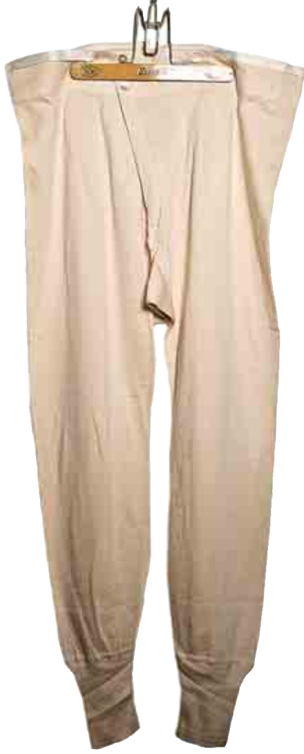
WARME BEINE. Ob eine lange Unterhose schön ist, darüber lässt sich vielleicht streiten. Aber nicht über ihren Nutzen.