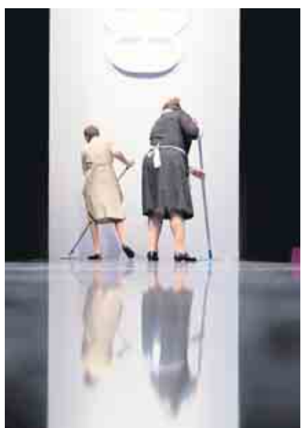
GRÖSSE BÜHNE. Vor der Show des Labels Basler wurden diese Putzfrauen unfreiwillig zu den Stars des Laufstegs.