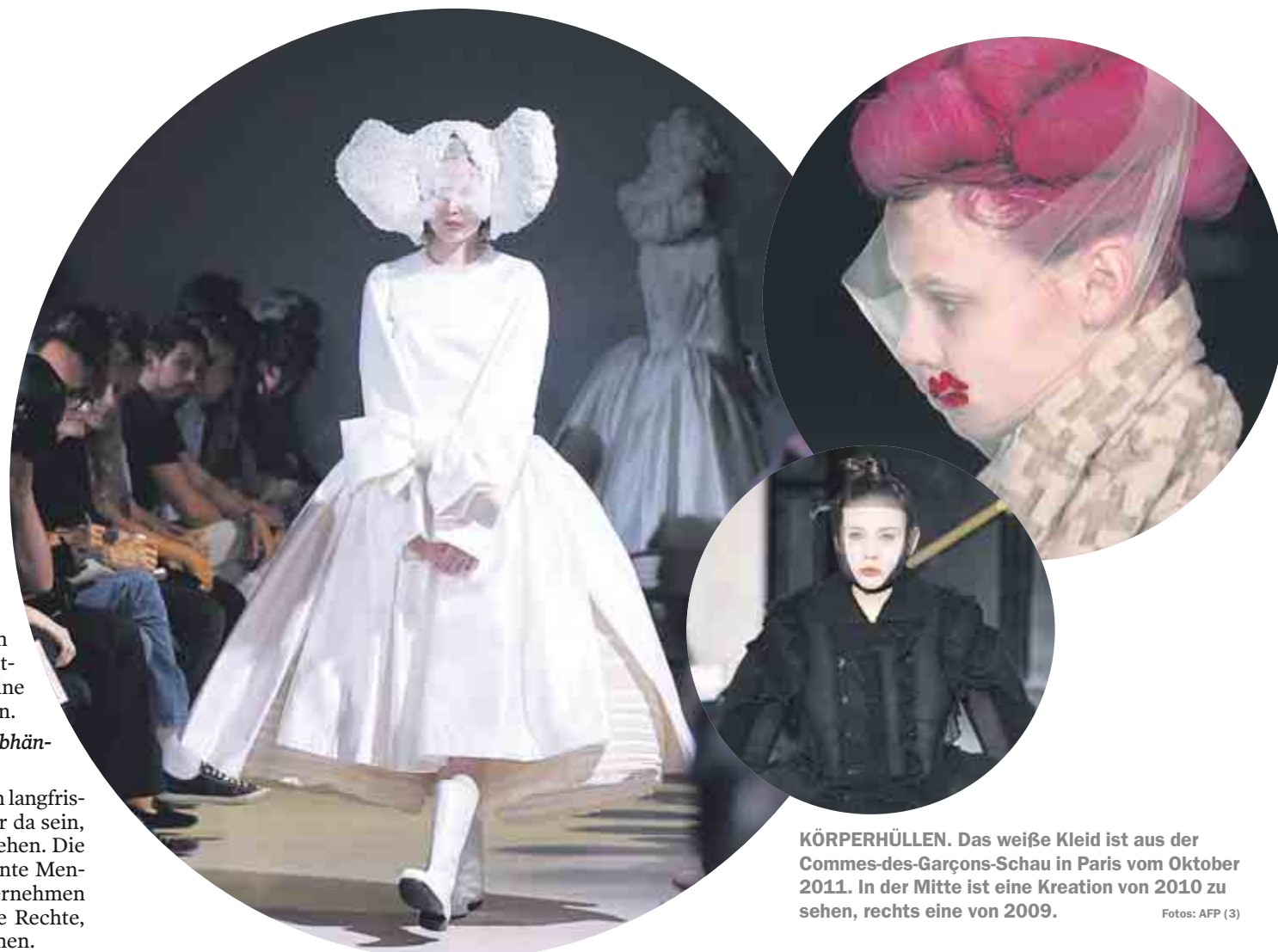
KÖRPERHÜLLEN. Das weiße Kleid ist aus der Commes-des-Garçons -Schau in Paris vom Oktober 2011. In der Mitte ist eine Kreation von 2010 zu sehen, rechts eine von 2009.