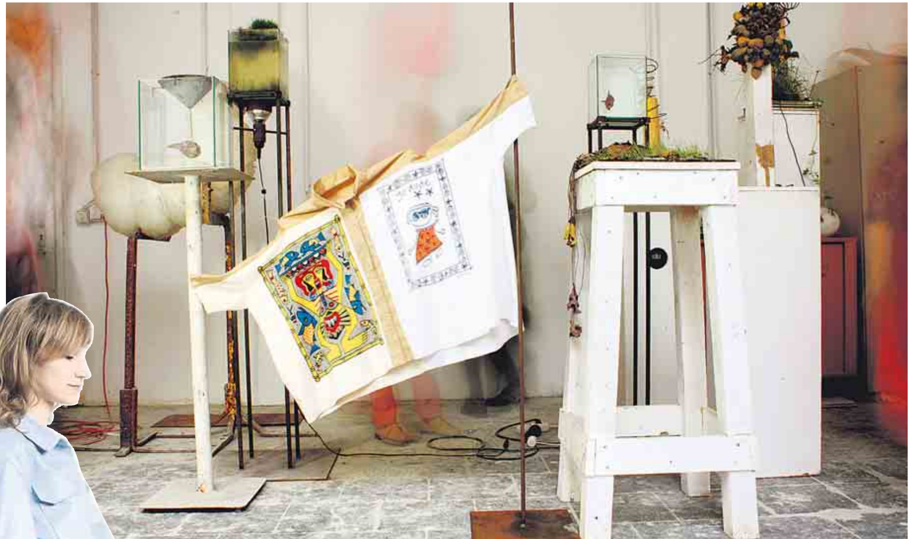
ALLES SO SCHÖN ALT HIER. Eine Installation von Schmidttakahashi. Das Kleid sieht recycelt aus. Aber es ist aus der Duplikat-Kollektion.

Der Erfolg der Kinkibox mag nur ein kleines Beispiel sein, doch er ist bezeichnend dafür, wie sich das Verhältnis zum Thema Mode in Berlin verändert hat: Der Gedanke von Handwerk steht wieder im Vordergrund. Man feiert private Näh- und Strickpartys, besucht DIY-Workshops oder Nähcafés, kauft und verkauft allerlei Selbstgemachtes wie Mützen oder Handschuhe auf den Internetplattformen „Etsy“ und „Dawanda“. Denn Handwerk, das bedeutet Beständigkeit, hohe Qualität und Einzigartigkeit. Etwas, wonach man sich nach Jahren des schnellen Konsums nun wieder sehnt. Ob die neue Denkweise ein Resultat der Finanzkrise ist? Sicher ist,