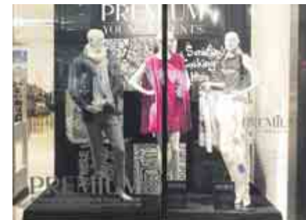
AUGEN DES LADENS. Schaufenster des KaDeWe (oben), ein interaktives Diesel-Fenster von Liganova und eines im Berliner Lafayette.