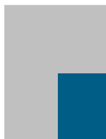
1/4 Seite B 128,3 x H 182,5 mm Preis: €2.550,00