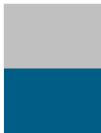
1/2 Seite B 260 x H 182,5mm Preis: €4.990,00