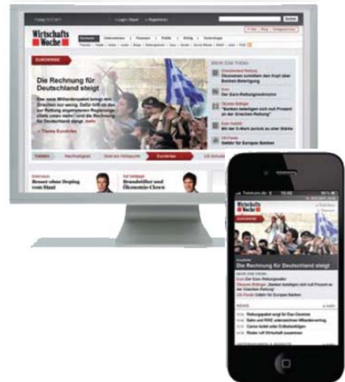
Vorab-Ansicht WirtschaftsWoche Online / WirtschaftsWoche Mobil