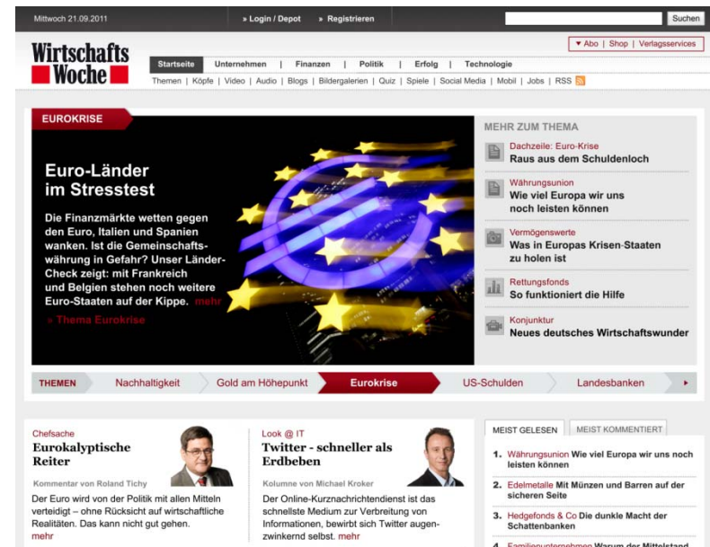
WirtschaftsWoche Online: Homepage