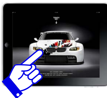
User wischt mit seinem Finger über die Werbung