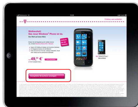
Fullsize Ad mit Verlinkung zum Virtual Supplement