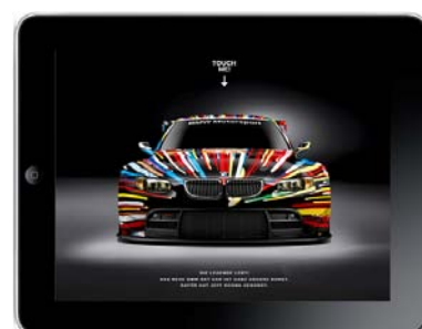
Dadurch wird das Auto „angemalt“