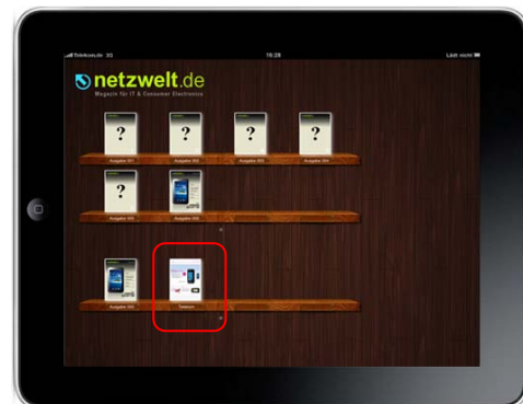
Prospekt steht im Magazin-Regal