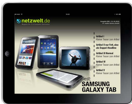
Start Cover des Magazins