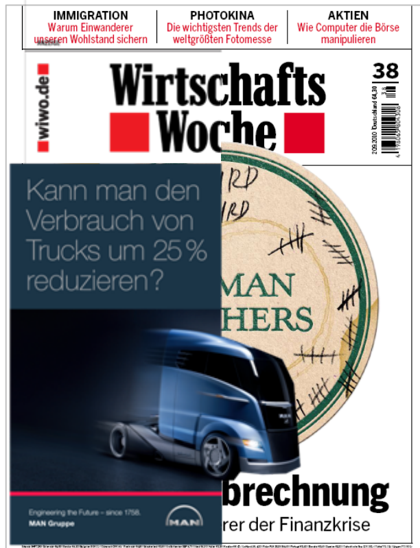
Gestanzte Titelflappe WirtschaftsWoche Aboauflage